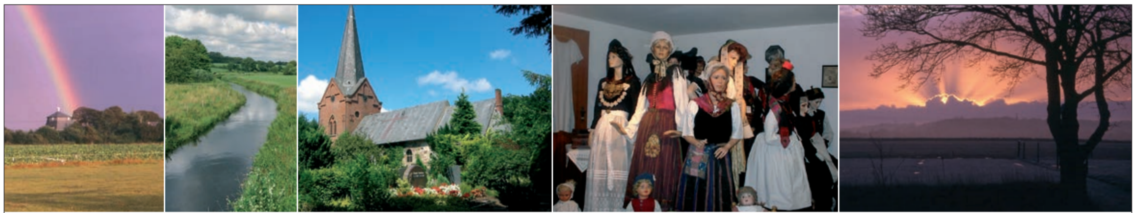
Petersburger Mühle in Drelsdorf